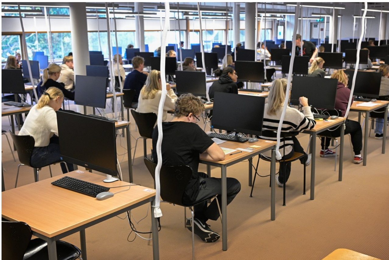
Drygt 50 000 personer brukar skriva högskoleprovet, som genomförs varje höst och varje vår.

Utformningen drabbar även eleven som får ett lågt betyg i ett par perifera kurser där denne inte drar jämnt med läraren. Givet denna stora svaghet i det nuvarande systemet är min bedömning att HHS ribba för HP-resultat borde lagts högre, vilket skulle öppnat upp för elever med lite lägre men fortfarande mycket högt meritvärde. Detta motsäger inte det faktum att ett ämnesbaserat betygssystem där meritvärdet baserat på slutbetyget i respektive ämne hade varit ännu bättre.