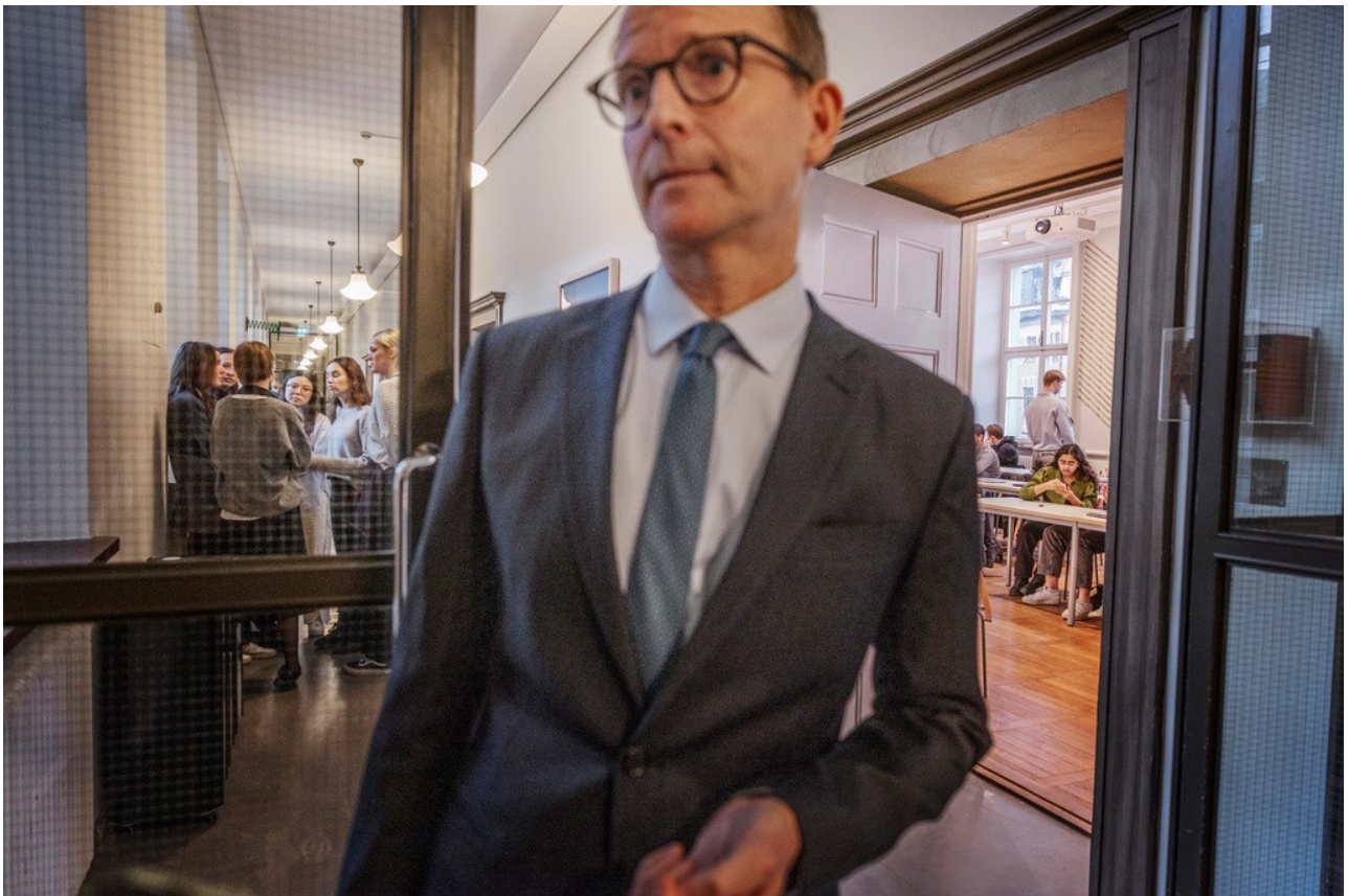
Handelshögskolans rektor Lars Strannegård.

Hur stor andel av de sökande kommer då att klara av det tilläggskravet? Det går att undersöka genom att för det första se vilket meritvärde som krävdes för att bli antagen till HHS grundutbildning 2023 och sedan se hur stor andel av dem som gick ut gymnasieskolan 2023 med ett tillräckligt högt meritvärde för att bli antagna på HHS, samt gjort högskoleprovet och fått ett resultat på 1,25 (av max 2,0) eller högre.