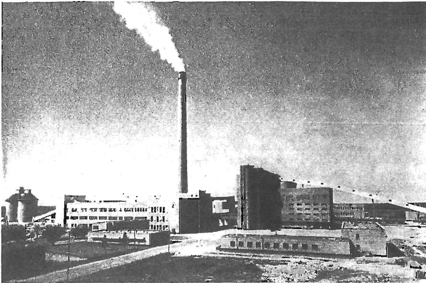
Enormt stark expansion i finska skogsindustrin. Här en bild från det till ungefär hälften statsägda bolaget Oulu Oy:s stora sulfatfabrik i Uleåborg. Årsproduktionen är nu 170.000 ton sulfatcellulosa, varav en del blekes, och ytterligare utvidgningar planeras.

aktiviteten alltjämt utgör en potentiell fara för prishöjningar.