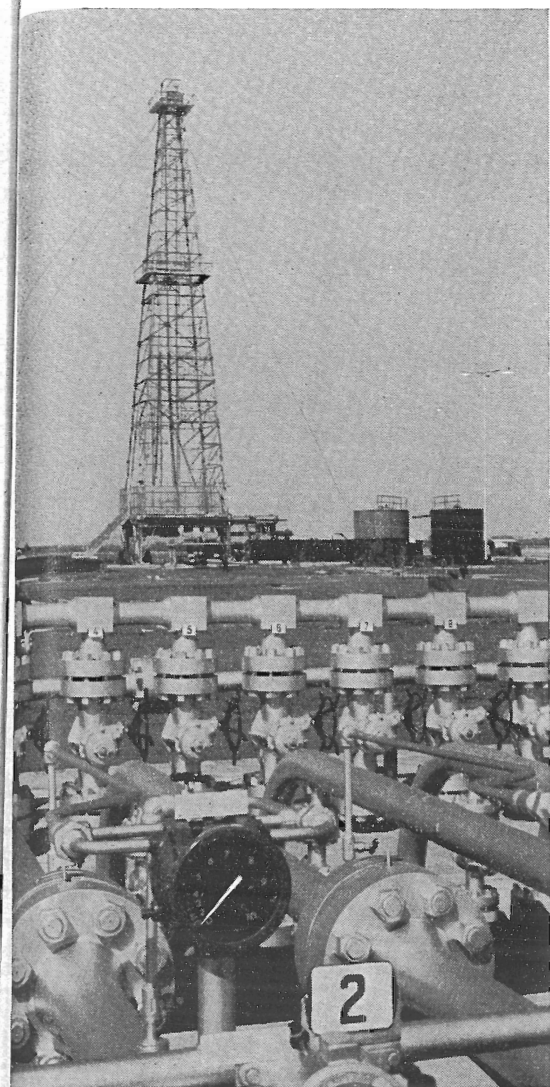
De stora holländska naturgasfyndigheterna är nu kommersiellt utbyggda för leverans över hela Holland och export till Belgien. Redan om något år är ledningsnätet klart ända ned till Parisområdet och till industrierna i nordöstra Frankrike. Bilden är från gaskällorna vid Slochteren.

EEC. Genom en rad ministerrådsdirektiv, däribland om lika rätt till socialförsäkringar, har denna fria rörlighet blivit förverkligad. Att omflyttningen mellan medlemsländerna inte blivit så stor som man på en del håll fruktade beror sålunda inte på formella hinder. Orsaken är främst