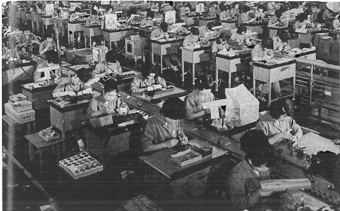
Nya expansionsindustrier har steg för steg fört utvecklingen vidare inom det japanska näringslivet. Transistorapparater, televisionsapparater och elektriska hushållsapparater har blivit exportframgångar tack vare storserieproduktion, som möjliggjorde lågprisavsättning i USA och Europa.

intresserade eller blir berörda av den japanska utvecklingen.