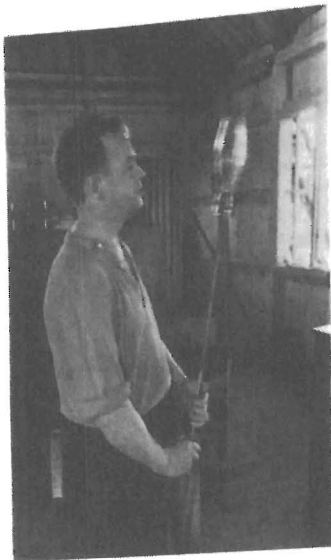
Glasbruket arbetar på sina håll som hantverksbetonade småindustrier

Det finns all anledning att antaga, att produktionen av varor och tillhandahållandet av tjänster kommer att fortsätta att utvecklas i allt mer differentierad riktning — kommer att tillfredsställa nya och mer sammansatta behov, försäkrade av en ständig stegring av levnadsstandarden. På det stora hela taget ha dock de konstaterade decentraliseringsstendenserna inom näringslivet hittills mindre berott på spridning och minskning av de varuproducerande industriella enheterna än fastmer på en ökning av alla de småföretag, som inom varje lokal enhet utgöra de "accessoir"-företag, som en höjd materiell och kulturell levnadsstandard kräver. Behovets differentiering i förening med allt påtagligare ekonomiska fördelar av decentraliserad produktion kan emellertid komma att kraftigt förstärka småföretagens betydelse även som producerande enheter.