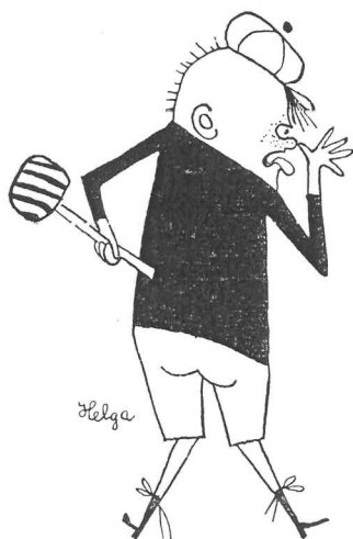
En elak gosse Ruda.

tycks alla utan invändningar acceptera utredarnas grundläggande värdering. Ingen har klivit fram med den morska frågan hur mycket vi egentligen skall investera, hur puritanska vi egentligen skall vara för att åstadkomma belåtenhet bland Sveriges store. Ändå innehåller utredningen en ren uppmaning till den som önskar leka elak gosse Ruda: »Sparandet kommer... att i högre grad än tidigare framstå som en 'social dygd' och en ökning av konsumtionsutgifterna som en 'odygd'.»