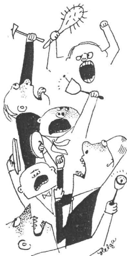
Ett ohyggligt oväsen bland de svenske.

På dessa sena stadier skulle naturligtvis ett alldeles ohyggligt oväsen uppstå bland de svenske. Därom tvekar ingen. Frågan är om Sverige — eller vissa kretsar i Sverige — skulle stegra sig redan tidigare.