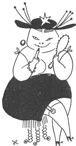
... om tonvikten i Sovjet förs över på lättsinniga varor ...